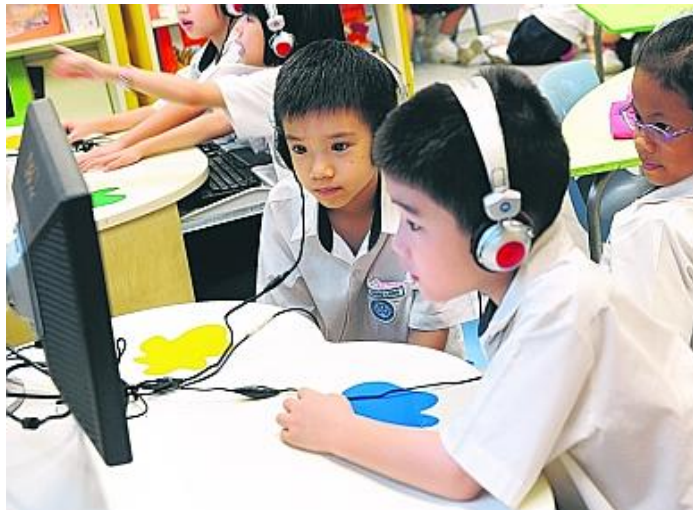
Niños y niñas de Singapur aprenden de manera cooperativa dentro de sus aulas.

Por ejemplo, Japón para ese fin utiliza “Comunidades de Aprendizaje”, las cuales permiten a los docentes compartir nuevas prácticas, aprender de las debilidades y fortalezas de cada uno y