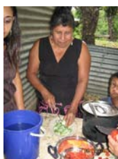
Jutiapa, Jutiapa, Ingenio Amayo. Junio 09