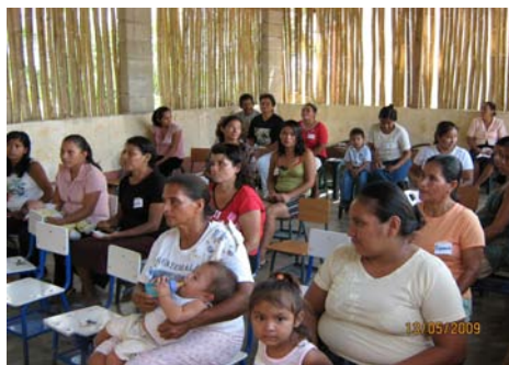
Izabal, Puerto Barrios, Aldea El Laurel. Mayo 09

A través de los cuales se busca fortalecer los sistemas de valores familiares, modificar patrones higiénicos y alimenticios inadecuados, así como fomentar las acciones de gestión social necesarias dentro de la comunidad.