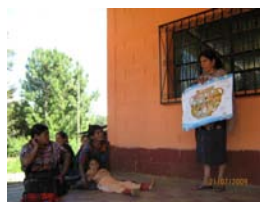
“7 pasos para una alimentación saludable” El Quiché, Chiché, Aldea Membrilla. Julio 09