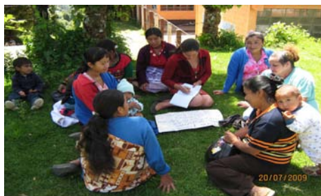
Jalapa, Jalapa, Aldea El Astillero. Julio 09

Los talleres son impartidos por 350 Formadores comunitarios, ubicados en 18 departamentos de Guatemala.