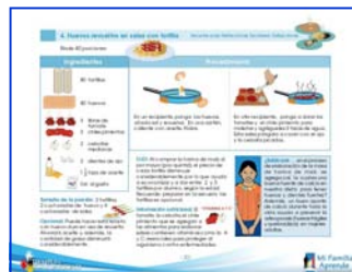
Ejemplo de una de las recetas.