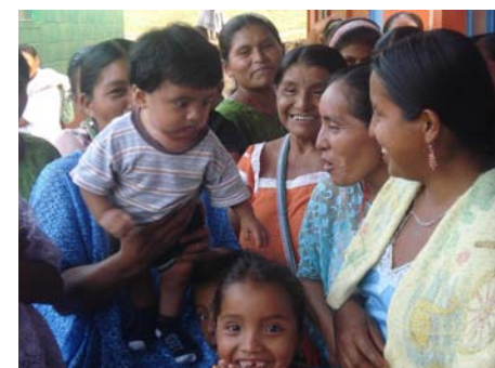
Alta Verapaz, Cahabón, Aldea Salac I. Abril 09

La EDUCACIÓN y FORMACIÓN en valores, se inicia en el seno de la familia, la cual constituye una fuente permanente de la identidad y autoestima de las nuevas generaciones.