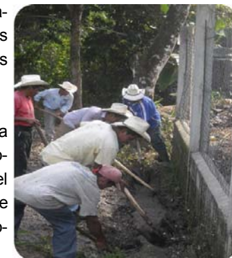
Chiquimula, Olopa, Aldea Tituque Abajo. 2009

A través de ella se supera el círculo vicioso de la pobreza, se promueve el desarrollo sostenible y se incrementa el capital social.