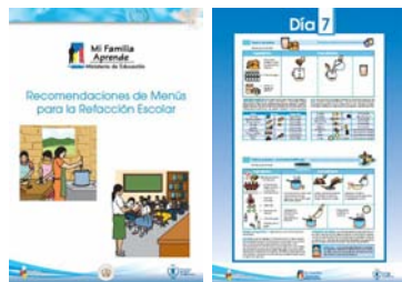
Calendario “Recomendaciones de menús para la refacción escolar”