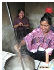
Sololá, Argueta, Colonia María Tecún. Junio 09