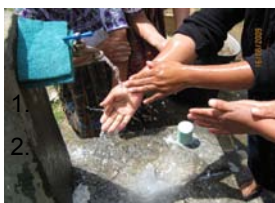
“Higiene en la preparación de los alimentos” Sololá, Nahualá, Aldea Xolcajá. Junio 09