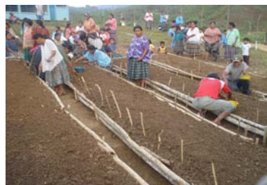
Alta Verapaz, Cahabón, Aldea Chinatal. Abril 09