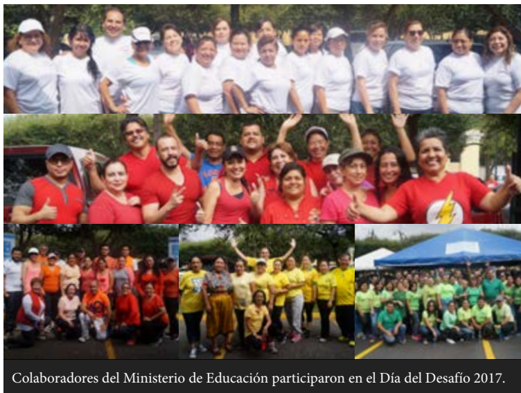
Colaboradores del Ministerio de Educación participaron en el Día del Desafío 2017.

En establecimientos educativos de los 22 departamentos del país, la actividad estuvo a cargo de maestros de educación física.