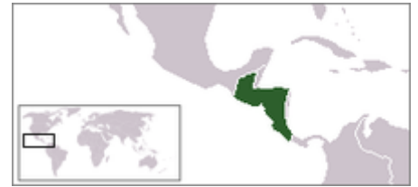
Provincias Unidas de Centroamérica.

El 1 de julio de 1823, se reunió en Guatemala el congreso, bajo la presidencia del presbítero José Matías Delgado , y declaró que las provincias ahí representadas eran independientes de España, de México y de toda otra nación . El nuevo país tomó el nombre de Provincias Unidas del Centro de América . Al día siguiente, 2 de julio, los diputados se declararon constituidos en Asamblea Nacional Constituyente y proclamaron que en ella residía la soberanía nacional, y pusieron en vigencia temporalmente la Constitución de Cádiz .