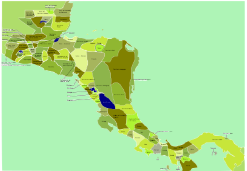
Mapa de las diferentes entidades territoriales que existían en Centroamérica en el siglo xvi antes de la llegada de los españoles.