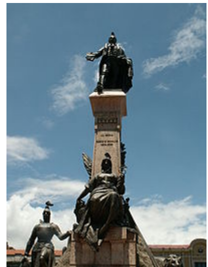
Monumento a Pedro Murillo, líder de la revolución independentista boliviana del 16 de julio de 1809 por la que fue ahorcado por las autoridades coloniales.

El 14 de septiembre se produjo la Revolución de Cochabamba , siendo depuesto el gobernador intendente y el 23 de septiembre se procedió a la jura y reconocimiento de la Junta de Buenos Aires con Francisco del Rivero como gobernador, quien reunió unos 2.000 soldados y envió a Esteban Arce a ocupar Oruro, consiguiendo el 14 de octubre el triunfo en la Batalla de Aroma . El 24 de septiembre Santa Cruz de la Sierra proclamó su adhesión a la Primera Junta de Buenos Aires.