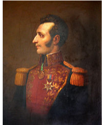
Mariscal Antonio José de Sucre Presidente de la República de Bolivia en 1825

Mediante un decreto se determinó que el nuevo estado llevaría el nombre de Bolívar, en homenaje al Libertador, quien a la vez fue designado "Padre de la República y Jefe Supremo del Estado". Bolívar agradeció estos honores, pero declinó la aceptación de la Presidencia de la República , para cuyo cargo designó al general Antonio