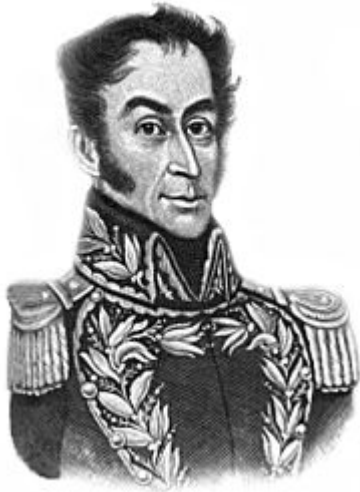
Simón Bolívar, El "Libertador"