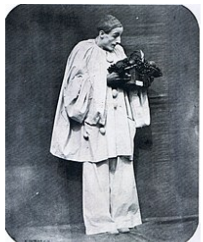
Charles Debureau (hijo de Jean-Gaspard) en el rol de Pierrot, fotografiado por Nadar en 1858. Biblioteca Nacional, París.