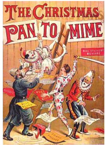
The Christmas Pantomime , Pantomime F. Warne & Co. (1890).