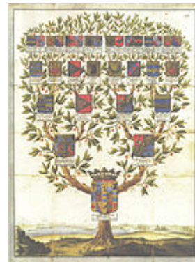
Árbol genealógico de Carl Gustav Bielke

El árbol genealógico no se aplica solamente en seres humanos, sino que también se utiliza para mostrar el pedigrí o ascendencia de un animal, representar la evolución de una lengua o idioma , seguir la trayectoria de un partido político , una disciplina artística o un arte marcial .