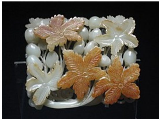
Ornamento de jade chino con diseño de flores, Dinastía Jin (1115 – 1234 AD), Museo de Shanghái.

El término obra maestra , en el contexto del arte y de la estética, se reserva en general para aquellas obras, ya sea artísticas o simplemente técnicas, consideradas, por los motivos que sean, como obras particularmente dignas de admiración. El origen del término «obra maestra» se remonta a los gremios de la Edad Media en Europa , en referencia a una pieza artesanal realizada por todo aspirante que en el seno del gremio desease adquirir el título de maestro [véase Obra maestra (gremio) ]. Con el tiempo este término pasó a ser un sinónimo de magnum opus , es decir la obra considerada como de mayor valor de entre todas las producidas por un artesano, un artista o un escritor. En el sentido actual del término, «obra maestra» se usa cada vez más como un término laudatorio, se refiera o no a la mejor obra de un autor (en este sentido suele admitirse que un artista, un pintor por ejemplo, haya pintado más de una obra maestra).