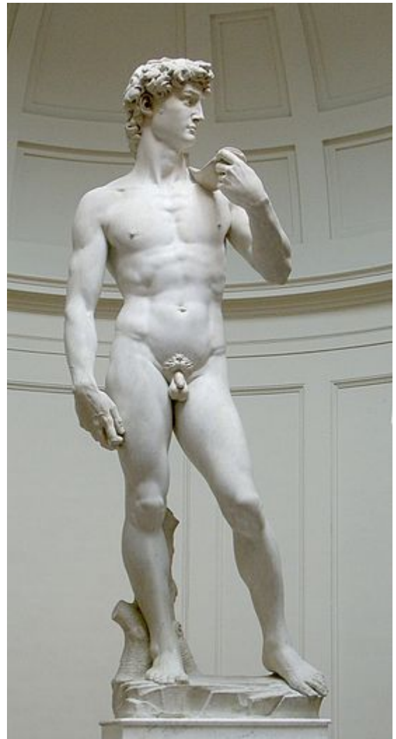
El David de Miguel Ángel, una escultura de mármol blanco realizada entre 1501 y 1504.

Obtenido de « https://es.wikipedia.org/w/index.php?title=Obra_de_arte&oldid=118658471 »