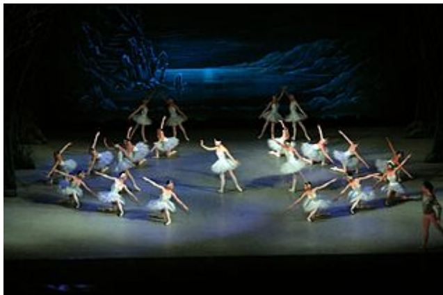
Representación de "El lago de los cisnes", de Piotr Ilich Chaikovski.