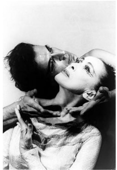
Martha Graham y Bertram Ross en 1961.

En 1998 , la revista TIME , la nombró " Bailarina del Siglo ", y una de las personas más importantes del siglo XX .